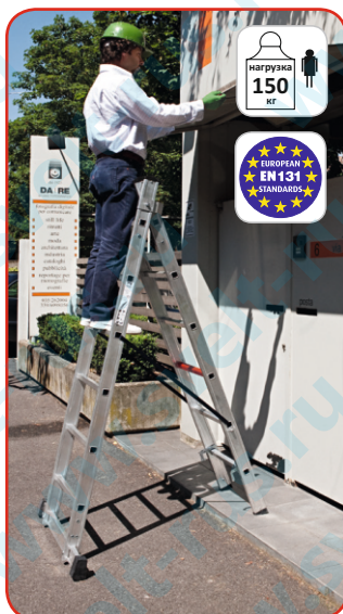
Макс. высота как стремянка 2,10 м.