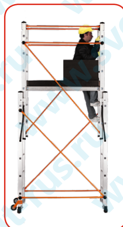
Легко пролезть через люк