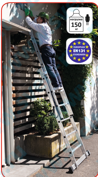
Макс. высота как проставная лестница 3,50 м.