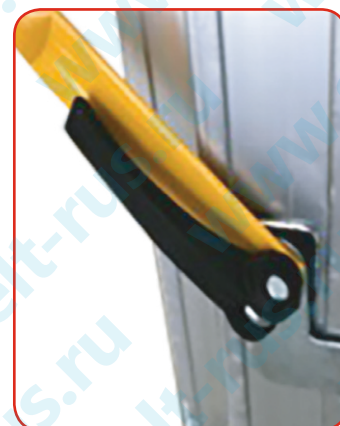
Система быстрой фиксации перекладин и перил