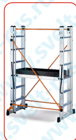
Платформа: 0,95 м Перила: 1,00 м Рабочая высота: 3,00 м Высота в закрытом состоянии: 2,15 м