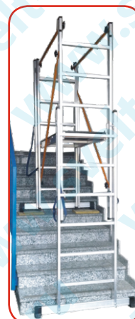
Можно использовать на лестнице